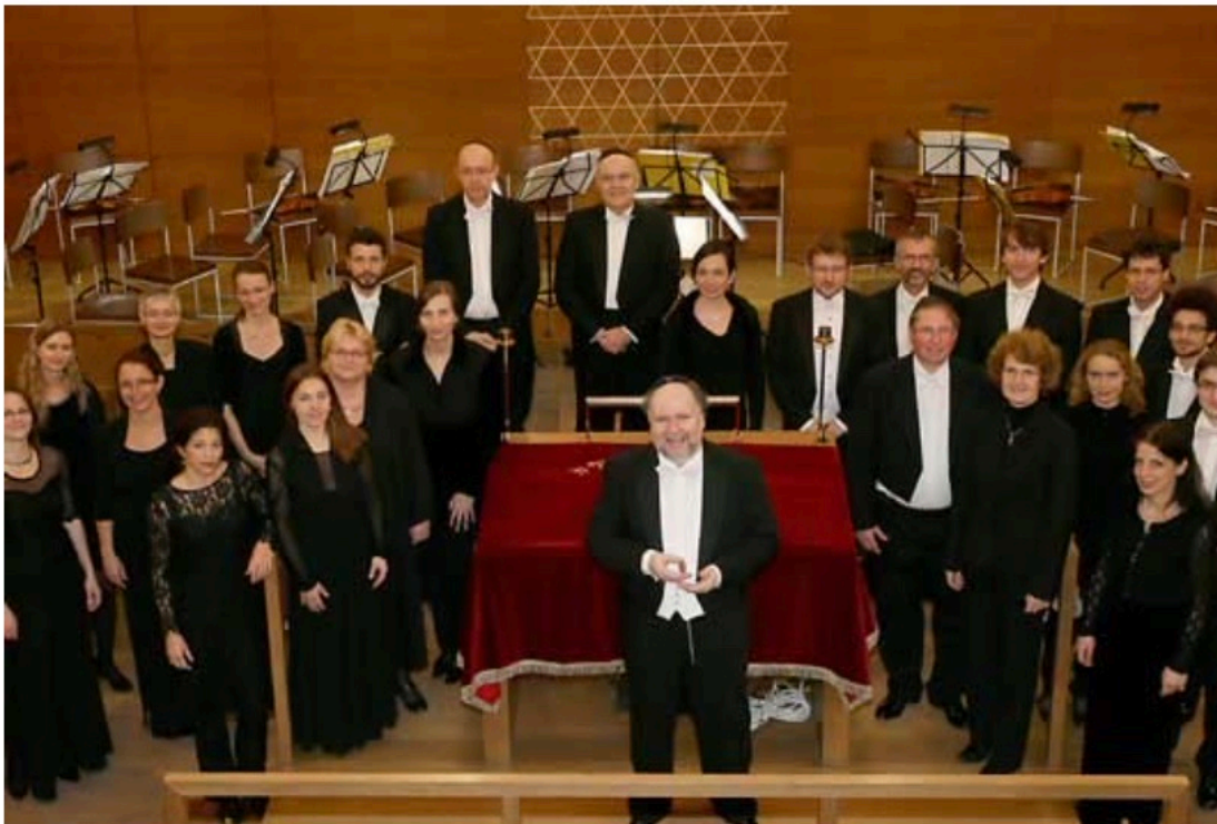
Neue Jüdische Kammerphilharmonie Dresden